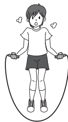
縄とび(続けてとぶ)