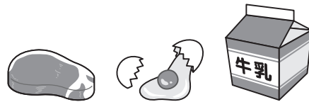
肉、卵、 ぎゅうにゅう 牛乳など