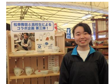
おばけのデザイン がユニーク