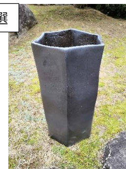
「銀角」 2年美術工芸科 宮崎虎之介君作品