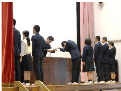
専門委員長の皆さん、よろしくお願いします。

4/23(火)各専門委員長の任命後、専門委員会の今後の活動計画を報告し、よい学校づくりができるよう、全生徒に周知しました。