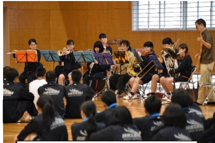
吹奏学部による歓迎演奏