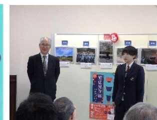
4/29 表彰式 (陶芸の館)