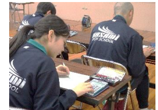
商業科：ビジネス基礎