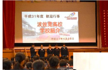
生徒会による学校紹介