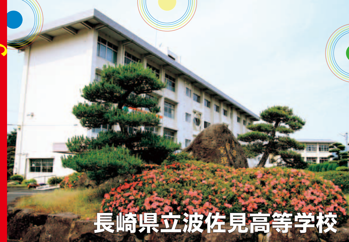
長崎県立波佐見高等学校