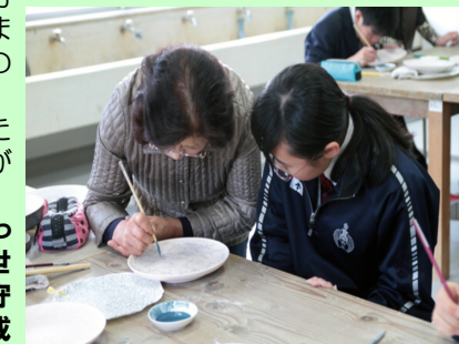
絵付けを学ぶ様子