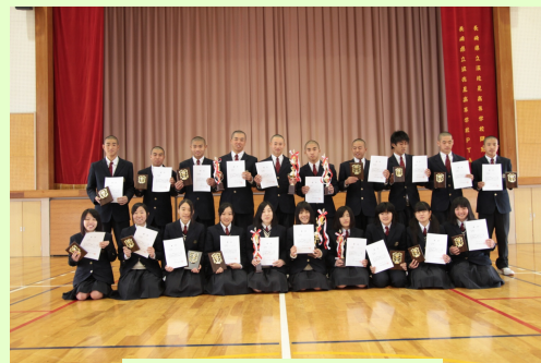
上位入賞を果たした生徒