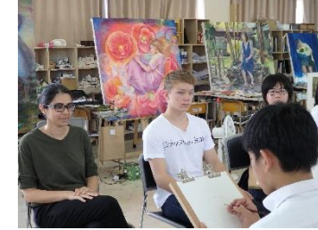
美術：デッサン（交互にモデル）