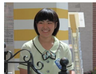
ウェルカムゲートでお客様をお出迎え

7月21日(土)より8月2日(木)までハウステンボスにおいて、1、2年生21名がインターンシップをさせていただきました。8月3日(金)のインターンシップ発表会では、それぞれに充実した実習だったと感想を述べていました。ハウステンボスの各担当の皆さま、本当にお世話になりました。