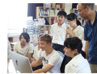
デザイン：名刺作り