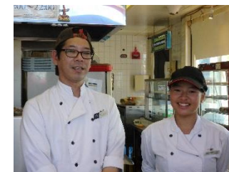
ハンバーガーショップ実習