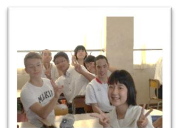
昼休み：2年1組の教室で