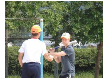
体育：ソフトボール