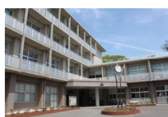
諫早高等学校附属中学校

県立中学校の募集要項の説明動画を長崎県公式チャンネルで YouTube にて配信いたします。