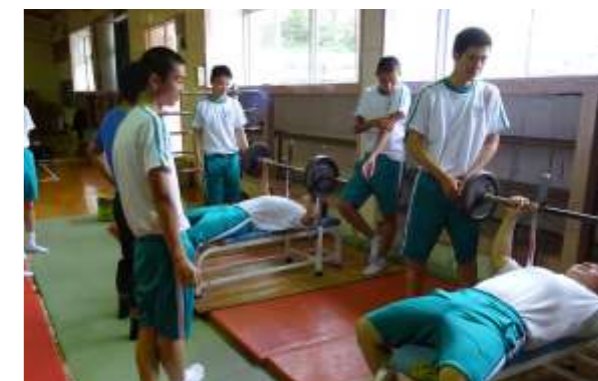
トレーニング理論