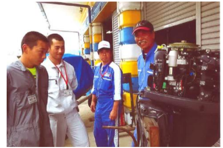
エンジンの勉強です