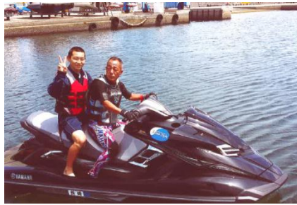
マリンボートに乗せて頂きました (株式会社ヤマハマリン西九州)