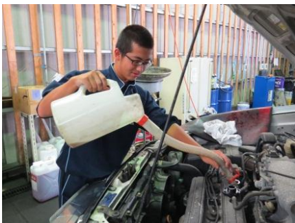
エンジンの点検をしています (TK グループハートモータース)