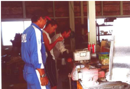
エンジンのチェックをしています

7月21日（火）から8月6日（木）まで、第2学年を対象に、将来のキャリアに関連した就業体験をすることにより、職業選択意識、学習意欲、社会適応能力の向上を図る目的で、県内の希望する事業所においてインターンシップを実施しました。各事業者のみなさまありがとうございました。