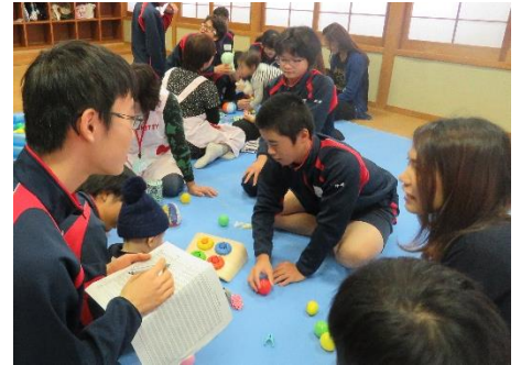
保護者の方に質問