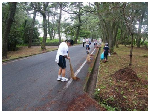
学校付近（小学1～3年生・高校3年生）

7月4日（木）、小中高合同での海浜清掃が実施されました。当日は天候が危ぶまれましたが、無事清掃を行うことが出来ました。清掃時間は約1時間でしたが、小中学校の生徒と協力し、どの地域も見違えるように綺麗になりました。