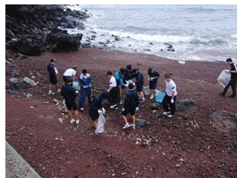
赤浜（中学2年生・高校1年生）