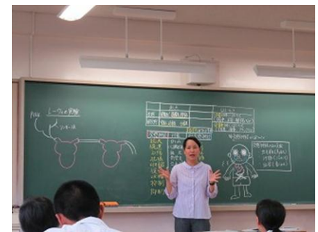
高2生物基礎「神経とホルモンによる調節」