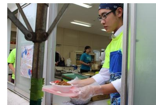
(文化委員会カレー販売)