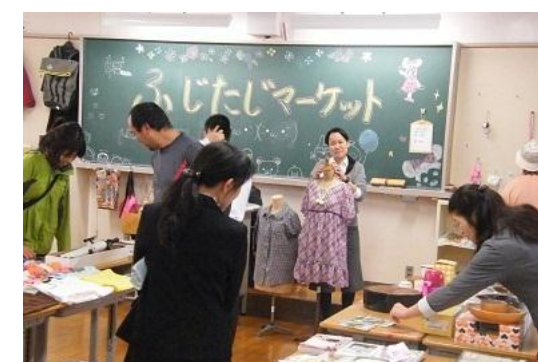
(3年2組フリーマーケット)