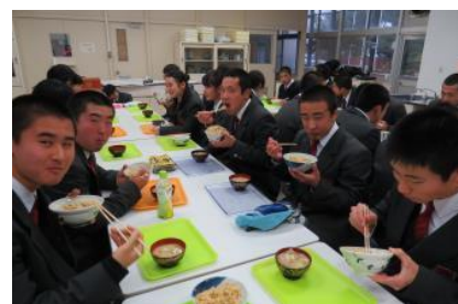
走った後のごはんは格別