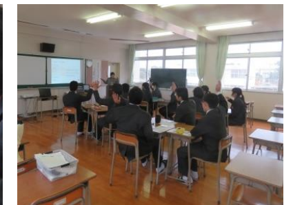
栄養のとりかたは