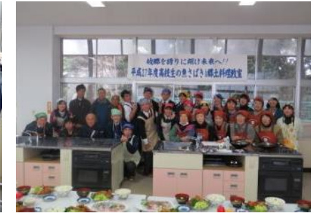
みんなで記念写真