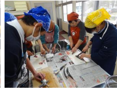
きれいに切れないな