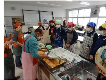
見事な包丁さばき！

1月27日（水）3年生を対象に魚おろし教室・郷土料理教室を実施しました。魚おろし教室の講師には指導漁業士およびPTA、郷土料理教室にはかーちゃんの会、および産業振興課の方々をお招きし調理、試食、交流をおこないました。慣れない魚さばきにははじめは少し戸惑いながらも楽しく調理を行ない、アジのフライやすり身のでんぷらなどを作りました。料理をしてみて、毎日料理を作ってもらっていることに対する感謝の気持ちをもった生徒も多かったようです。島を離れる生徒たちにとって、小値賀の食材に触れることは小値賀を見つめ直す良い機会となり、地産地消と食育についても理解を深める良い機会となりました。