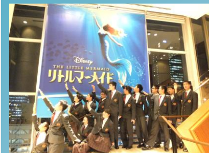
劇団四季「リトルマーメイド」