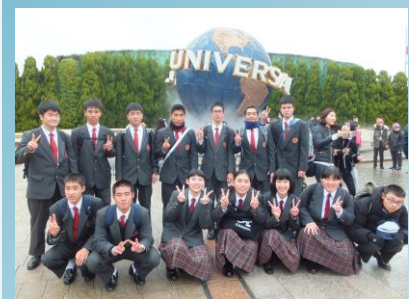
ユニバーサルスタジオジャパン