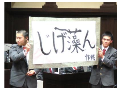
作戦名「じげ藻ん作戦」