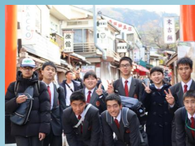
伏見稲荷大社(京都自主研修)