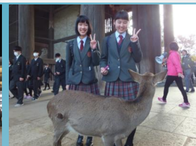
薬師寺・奈良公園