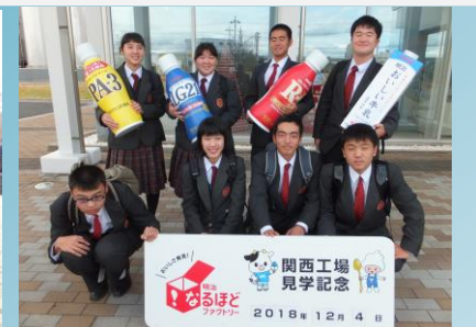
明治なるほどザ・ファクトリー