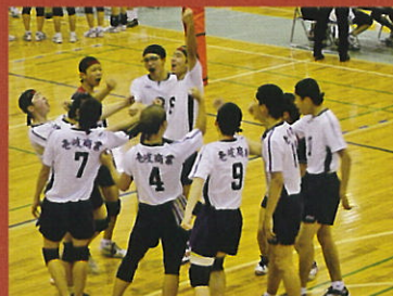
バレーボール部男子