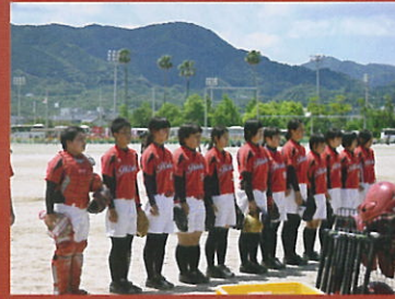
ソフトボール部女子