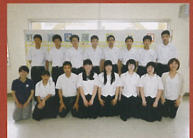
ボランティア同好会