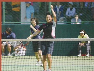
ソフトテニス部女子