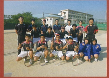
ソフトテニス部男子