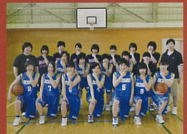
バスケットボール部女子