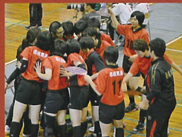
バレーボール部女子