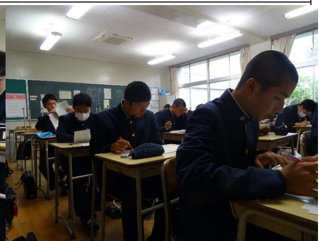
3年生の補習の様子