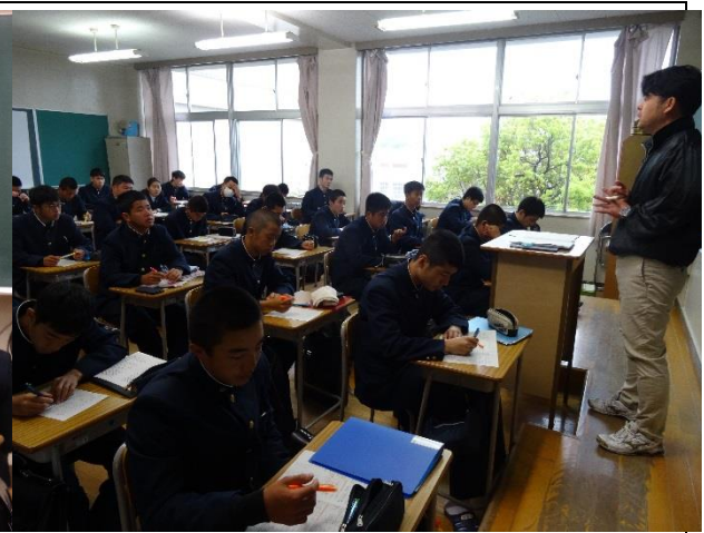
2年生の補習の様子