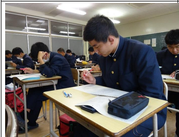
3年生の補習の様子