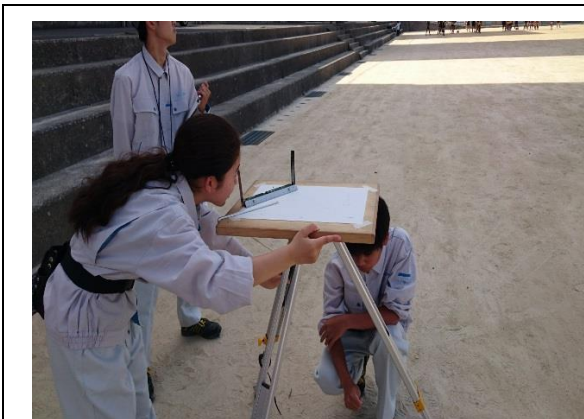
1次作業、平板測量。 方向を合わせます。

前年は本校の環境創造科チームが全国最優秀賞（全国1位）を受賞しております。お互い切磋琢磨して当日の本番に向け、努力していきます。