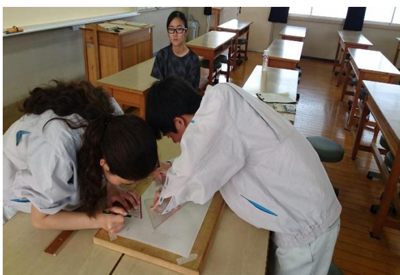
3次作業（内業：三斜法） 図面を仕上げながら、面積を出します。