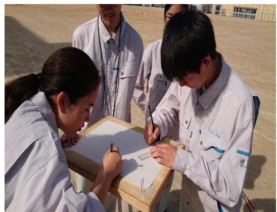
外業での図面作成。 チームで協力して仕上げます。