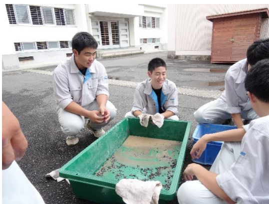
粗骨材（砂利）の水分調整