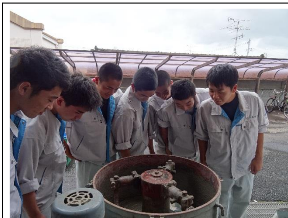
コンクリート練り混ぜ機械を観察

材料施工実験では、セメントや骨材の性質に関する実験やコンクリート作成を中心に行っています。建物を作るときの基礎となる実験をすることで、安全な強度と耐久性を知り、これから現場で活躍できる人材になって欲しいと思います。