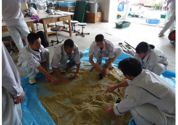
細骨材（砂）の水分調整