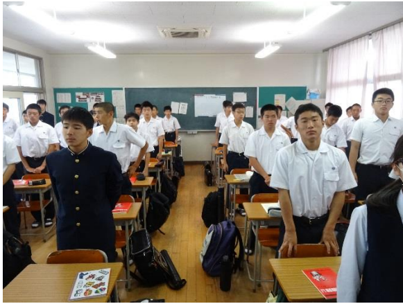
今から補習を始めます。

朝早くから初めて取り組む補習ということもあり全員合格を目指します。この資格を取得し、このあとに続く資格試験にも合格できるよう弾みをつけて欲しいと思います。