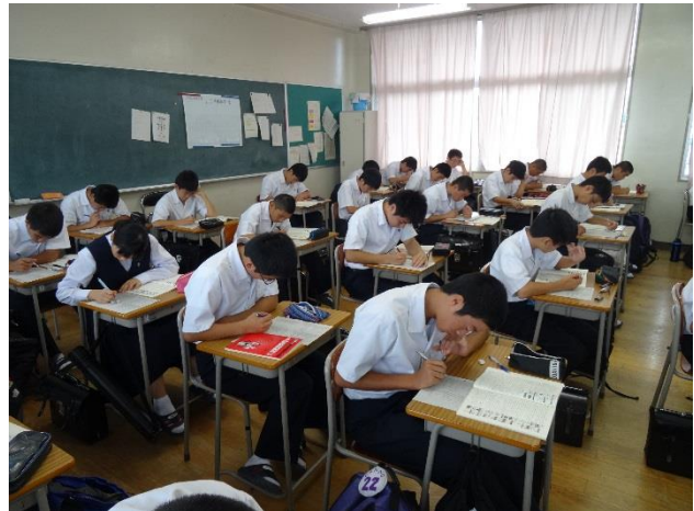
真剣に問題を解いています。