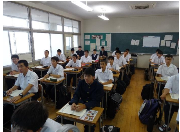
注目して説明を聞きます。