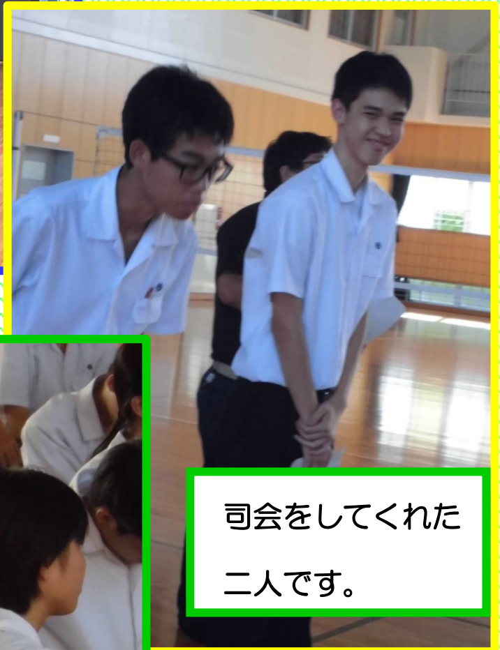
司会をしてくれた 二人です。