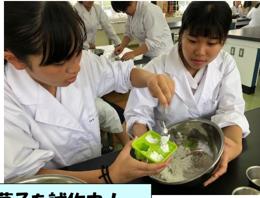
ラムネ菓子を試作中！