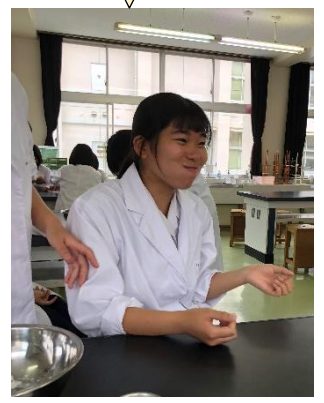
どんな形が作りやすいか、喜んでもらえるかを検討しています！