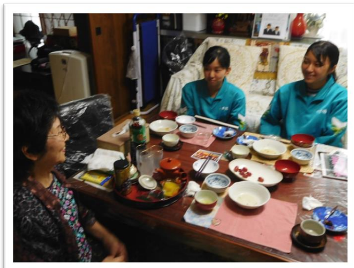
ゆっくりとお話。あったかい気持ちになります。