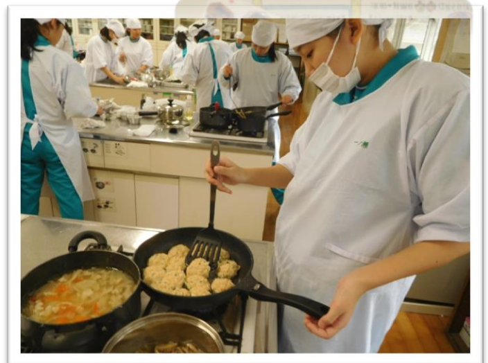
ハンバーグは、きつね色に・・・。