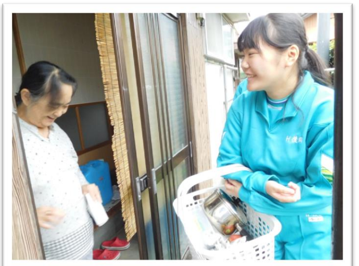
『12月にまた伺いますね』