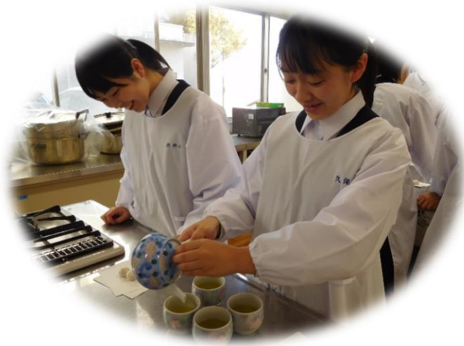
廻し注ぎで濃さを一定にします。