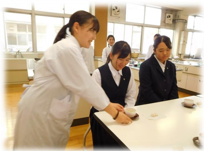
茶たぐに茶わんをセットして、お茶をどうぞ♪ 席次も考えて、上座の方からお配りします。