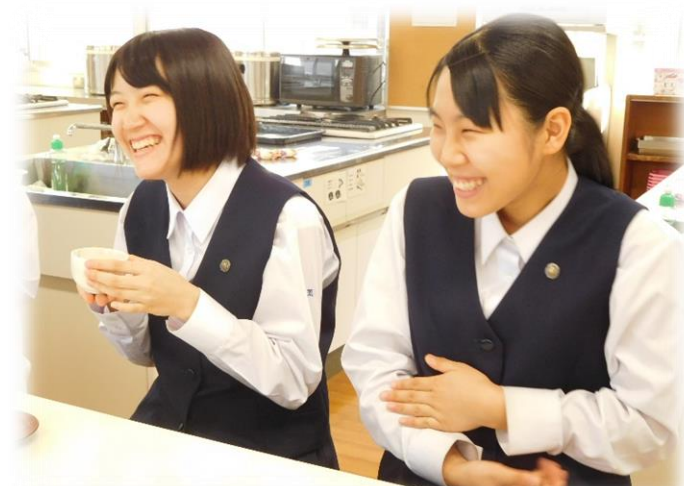
至福のひととき・・・♡