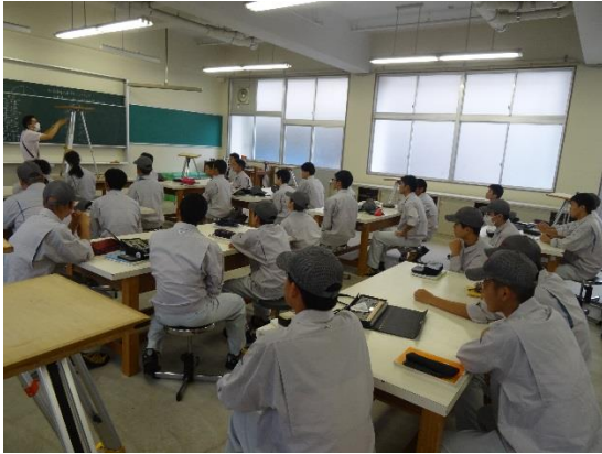
平板のすえつけ方法の説明を聞きます

8月から本校は夏休みに入りますが、1年生は夏休み中に総合実習の一環として平板測量を行い、広大な本校の敷地の平面図を作成します。その練習として先日、初めての測量実習を行いました。班員で協力して全員が技術を高め、夏休みの準備を行いました。農業土木科では測量や土質・材料・水理など様々な実習を行います。農業土木に関する技術・知識を身に付け、現場で活躍できる人材になって欲しいと思います。