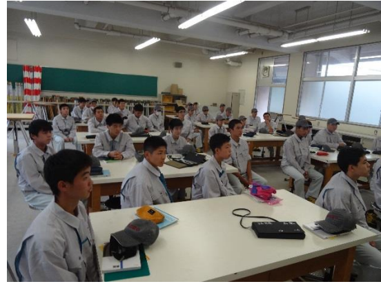
説明をよく聞き実践します。