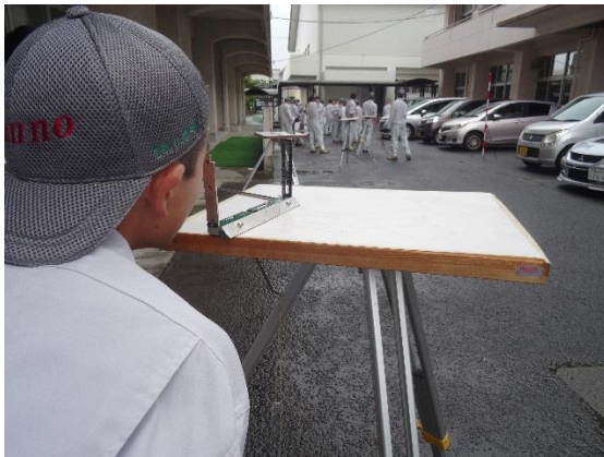
ポールにあわせて測量します