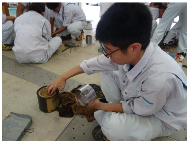
グリース（剥離剤）を塗ります。