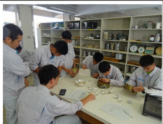
粒度試験。ふるいの小粒も見逃しません。