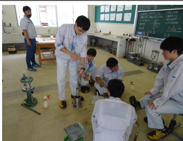
土の締固め試験。締固め中。

土質実験では、土の密度や透水性、含水比（水をどのくらい含んでいるのか）などを測定しています。建物を作るときの基礎となる実験をすることで、安全な強度と耐久性を知り、これから現場で活躍できる人材になって欲しいと思います。