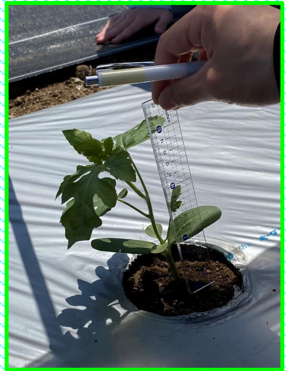
苗を植えたら観察です