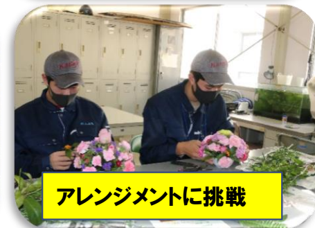
アレンジメントに挑戦