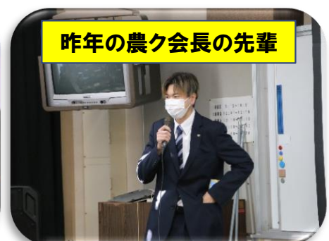
昨年の農ク会長の先輩

全体説明のあと、さっそく野菜・果樹・草花の専攻に分かれて実習に取り組みました。私たちのために多くの実習メニューを準備していただき、充実した楽しい研修となりました。