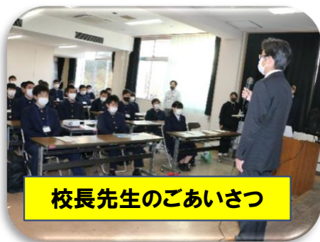
校長先生のごあいさつ

昨年度は農業科学科から11名が農業大学校へ進学されました。楽しそうに学校生活を送っていらっしゃる先輩方が印象的でした。