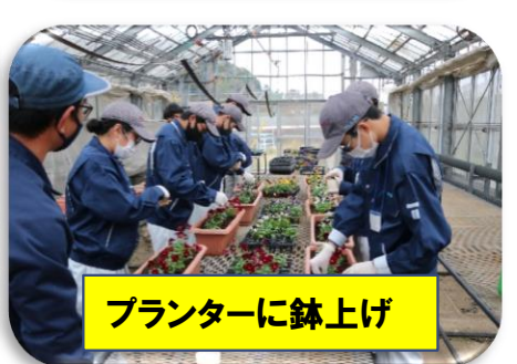
プランターに鉢上げ

農業科学科は農業大学校への進学が最も多い学科です。 来年度は9名が進学予定です。