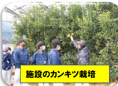
施設のカンキツ栽培