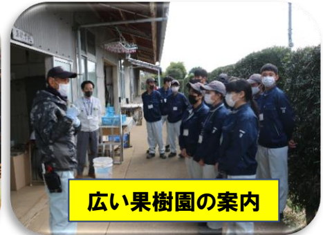
広い果樹園の案内