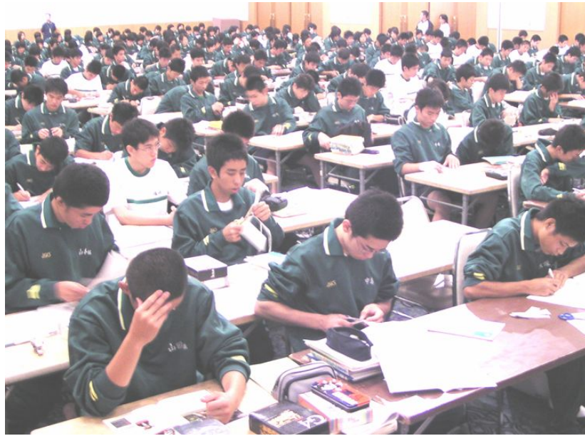
(佐世保での宿泊学習1年生)

なお、3年生の雲仙学習合宿は8月5日(日)より11日(土)までの6泊7日で実施します。学習時間の合計は61時間20分です。