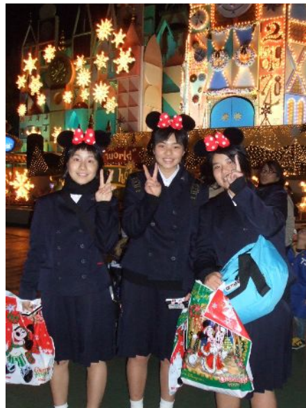
東京ディズニーランドで楽しむ生徒たち→