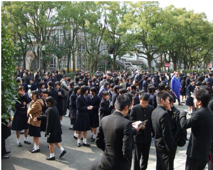
↑ 受験会場（長崎大学）で

また、1月17日(土)、18日(日)の両日も、多くの1、2年生が朝早くから学校に集まり、バスで出発する先輩達を見送り、健闘を祈るとともに、1年後、2年後の自分たちの姿を思い描いて、気持ちを引き締めていました。