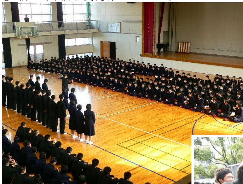
最後に、先生のパワーを・・・↓