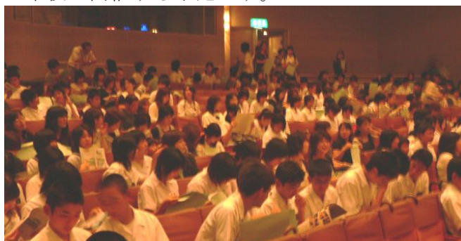
参加していただいた中学生と保護者

6月28日（土）諫早文化会館において第1回学校説明会を開催しました。640名の中学生・保護者の方々に参加していただきました。校長先生の挨拶の後、放送部の生徒たちが制作したビデオで学校紹介を行い、先生たちが諫早高校について説明しました。後半は生徒たちの活動が中心となり、理数科生物班が課題研究を発表し、普通科や理数科の生徒たちが諫早高校での楽しい学校生活を語りました。最後に、ギター・マンドリン部が歓迎の演奏を行い、応援団が熱くエールを送りました。第2回学校説明会は10月11日（土）に本校で開催する予定です。