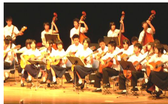
演奏するギター・マンドリン部