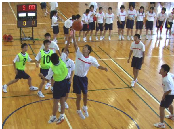
男子バスケットの試合