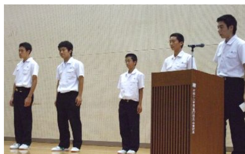
インターハイに出場する 左：陸上部 右：フェンシング部