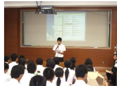
開会の生徒代表あいさつ