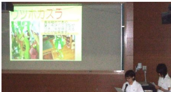
最優秀賞「ウツボカズラの消化作用について」の発表