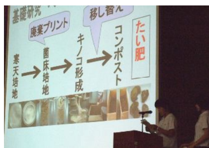
2年理数科生物班の研究発表