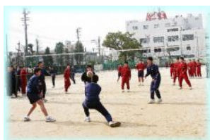
男子バレーボール