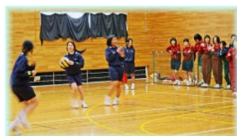
女子ドッジボール