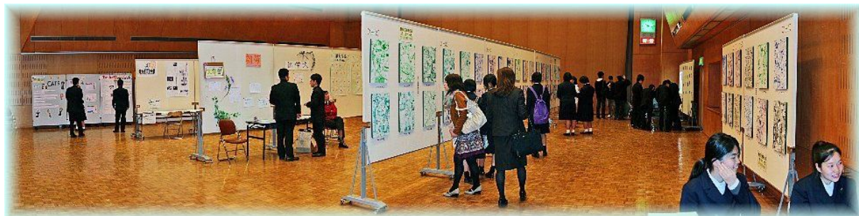
作品展示 (美術・新聞・文学・パソコン・科学・写真・英語・図書・イラスト・書道)