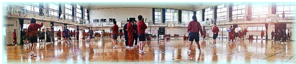
女子バドミントン