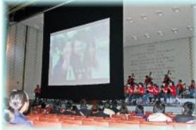
放送部による学校紹介