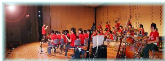
ギター・マンドリン部の演奏