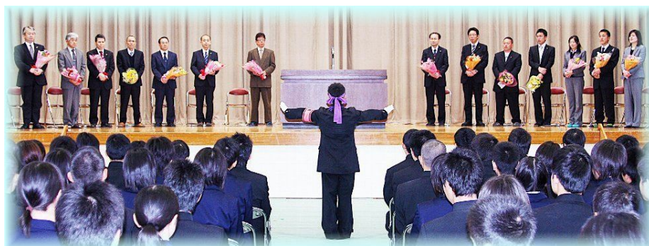
応援団のエールに送られる離退任の先生方