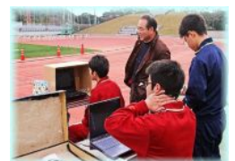
記録集計（パソコン部）