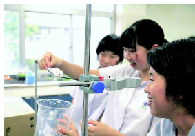
ラットに触れる中学生

6月25日（土）本校体育館において、諫早高校の第1回学校説明会を実施しました。700名の中学生・保護者の方々に参加いただきました。