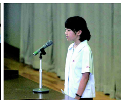
附中生による説明