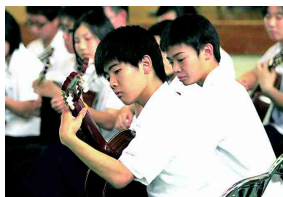
ギタ・マン歓迎演奏