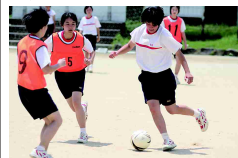
迫力なでしこ並み