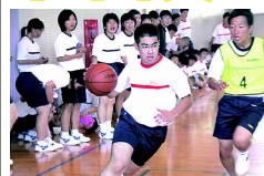
闘志漲るドリブル