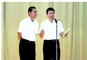
絶妙の爆笑コント