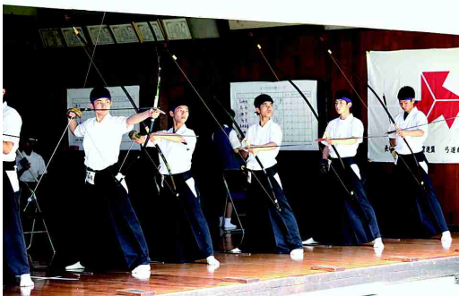
優勝を果たした弓道男子

他にも、フェンシング部男子が準優勝し、テニス部男子、ソフトボール男子、陸上女子総合が第3位に輝きました。また、今年の特徴として、上位入賞の部活動が多く、ラグビー、剣道女子、卓球男子、ソフトテニス男子、バスケットボール女子が激戦を勝ち抜いてベスト8に輝き、文武両道の真髄を見せ、創立100周年を飾る素晴らしい成果を残してくれました。