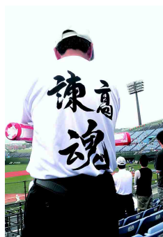
全校応援に臨む 勝負服の校長

しかし、グラウンドで奮闘する野球部とスタンドのOB、保護者、附中生・諫高生が本当に一枚岩となった見事な応援でした。こうした機会を与えてくれた野球部に改めて感謝します。