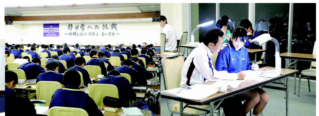
一斉学習室の様子