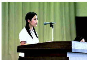
落ち着いた委員長挨拶