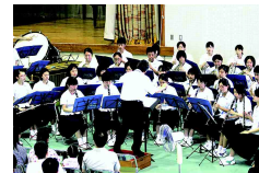
吹奏楽部歓迎演奏