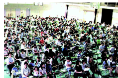
熱気あふれる会場