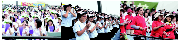
諫高大応援団(左から高校、附中、保護者)