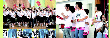
盛り上がるブラス 跳ねるギタマン