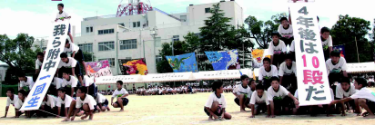
附中生 ピラミッド