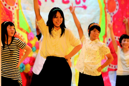
舞台上映える最高の笑顔