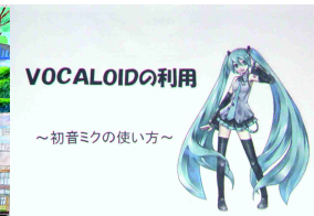
VOCALOIDの利用 ~初音ミクの使い方~ パソコン部

今年度は諫早高校創立100周年記念文化祭と冠して、9月2日(金)に校内向け、3日(土)を公開用として、2日間にわたる大文化祭を開催しました。体育大会と統一テーマである【百華諫道】は、諫高生・附中生一人ひとりがそれぞれの『華』を咲かせることを祈念するとともに、本校の教育スローガンである「諫高道」を究める中で、互いに心を磨きあい、多くの『感動』を共有していくことを願って採択されました。残暑厳しい日となりましたが、近隣の中高生や保護者はもちろんのこと、同窓の方々や地域の方々にもお越しいただきました。