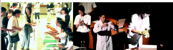
保護者に人気の諫高 アカデミックな理数科実験

8月2日(火)、約520名の中学生・保護者を迎え、第2回の学校説明会を諫早文化会館で開催しました。誇れる諫高生をより前面に出し、入試体験談や理数科課題研究の紹介など新しい企画を取り入れました。「諫高」の目指す人間教育を十分に理解してもらえたと思います。また、本校教師による高校入試ワンポイントアドバイス、吹奏楽部の演奏、応援団の演舞も大好評でした。