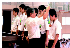
全国3位! 弓道の銅メダル