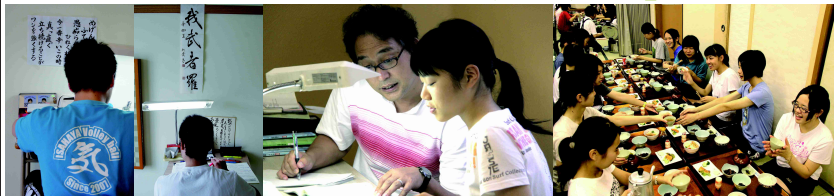
顧問の檄文が励み！ 基本は「師弟同行」 楽しみな食事時間