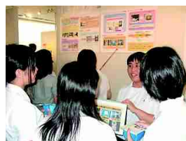
他校生に説明する生物班