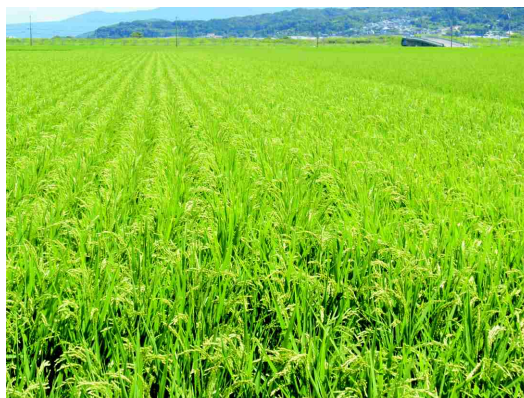
『広大な田園風景（諫早平野）』

秋の休日、自宅近くの田園風景が広がる田んぼの中道を車で走っていると、たわわに実りはじめた稲の穂が風に揺られながらその存在をアピールしているように見えた。梅雨時期の田植えから今日まで稲はどれくらい大きくなったのだろう。毎日通る道ではあるが、気にしていないと気付かない。自然の中に当たり前のようにある風景だからだろうか。しかし、稲は暑さや強風、大雨、害虫など自然と常に闘いながら着実に成長している。人の手がもちろん入っているが、成長するエネルギーは稲自身もっている。人間と同じである。