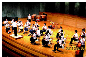
ギタ・マン部全国舞台へ