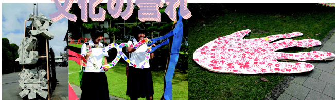
歓迎門 中庭装飾1 中庭装飾2