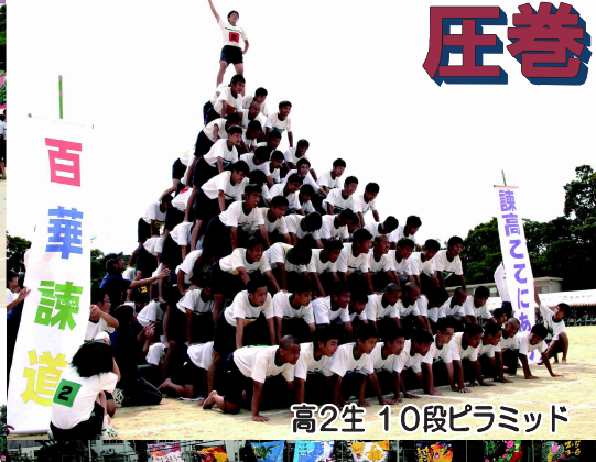
高2生 10段ピラミッド