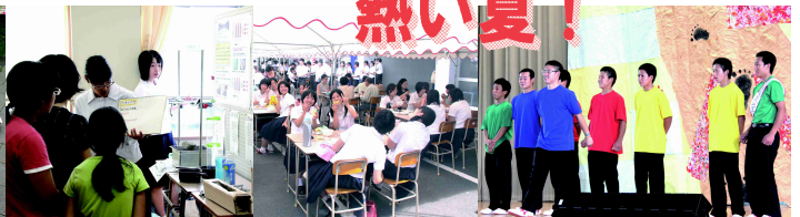
理数科ポスターセッション 2-2バザー ブロック長