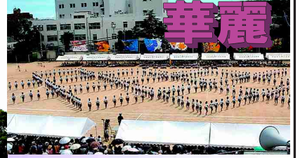
女子プロムナード