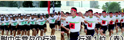
附中生堂々の行進 行進1位(赤)