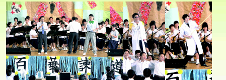
あの先生!もステージで炸裂