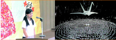
実行委員長挨拶 見事な折り鶴