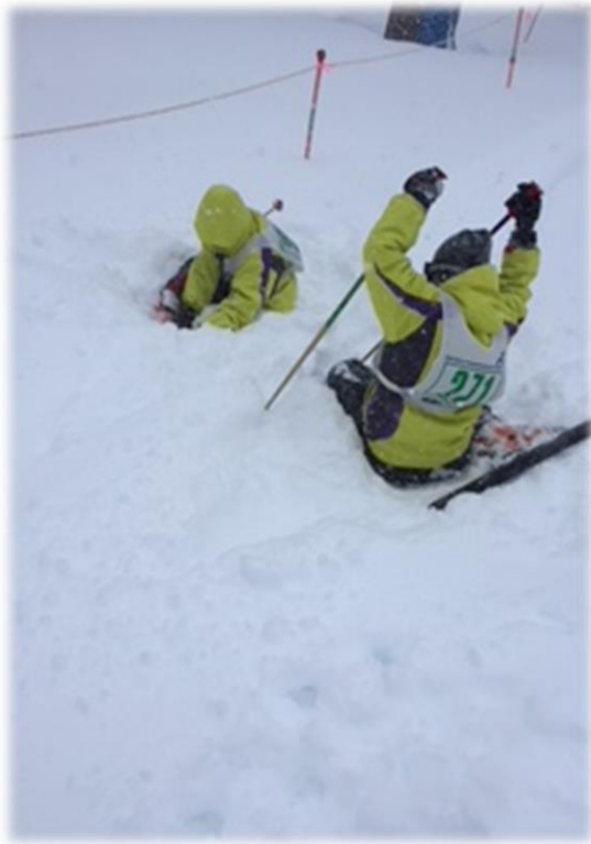
2018/1/31の様子 やや視界不良..