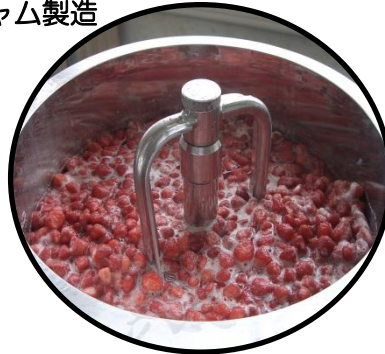
イチゴジャム製造