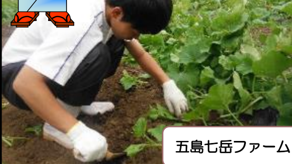
五島七岳ファーム