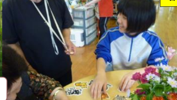
デイサービスセンターはまゆう