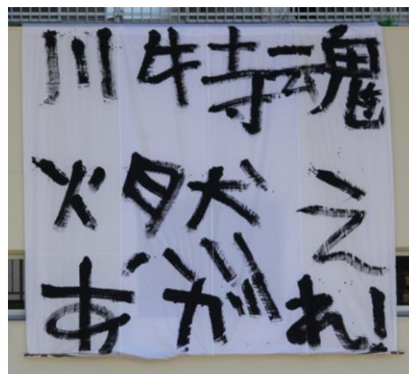
（平成29年度運動会高等部生徒作品）

本校の新しい校歌の一節にある「ふるさとになるこの地から 自分の翼 ひろげ飛ぶ」心身ともに強く、優しい子供たちを育て、社会へと送り出せるように、日々の教育活動に取り組んでいきたいと思ひます。