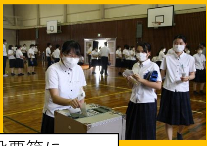
各学年の投票箱に・・・