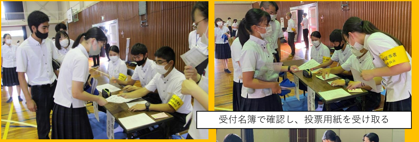
受付名簿で確認し、投票用紙を受け取る