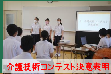
介護技術コンテスト決意表明