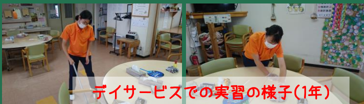
デイサービスでの実習の様子(1年)

7月6日(火)~9日(金)の4日間、全学年、施設での介護実習を行いました。1年生は入学して初めての施設実習ということで前日に壮行式を実施し、ひとり一人が決意表明を行いました。1年生はデイサービスや通所リハビリテーション、2年生はグループホーム、3年生は特別養護老人ホームや介護老人保健施設などで実習させていただきました。コロナ禍の中、実習を引き受けてくださった施設の皆様にはこの場を借りて感謝申し上げます。