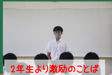
2年生より激励のこたば