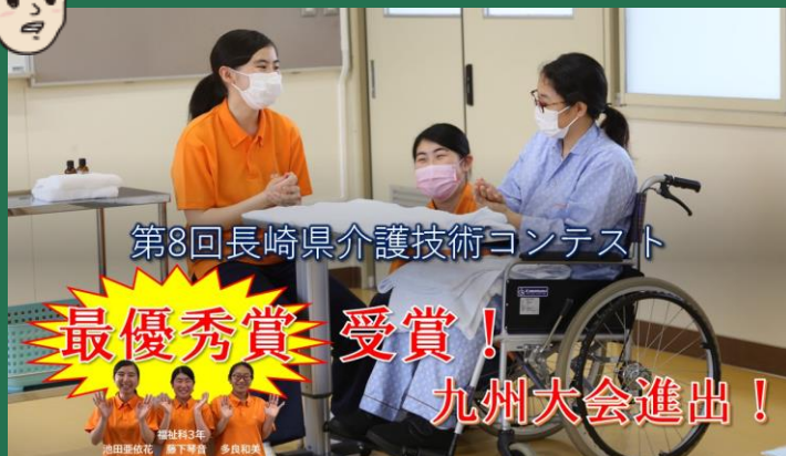
第8回長崎県介護技術コンテスト