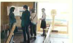
▲探究活動(春板班によるアンケート調査島原城天守)