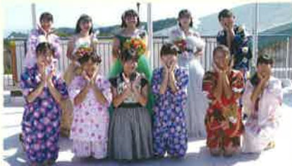
▲ドレス製作・和洋服製作ファッションショー