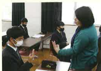
▲ふくしらぼ(手話講座)