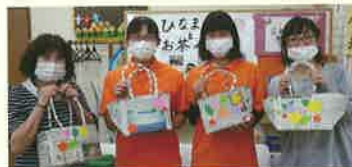
▲デイサービス実習(職員さんと)