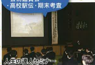
人生の達人セミナー