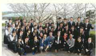
▲校内語学研修(R2海外研修代替で実施)