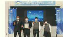
▲外部大会での探究結果の発表