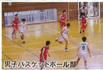
男子バスケットボール部