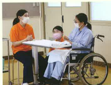
▲令和3年度第8回長崎県高校生介護技術コンテスト最優秀賞受賞!