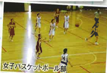
女子バスケットボール部