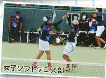
女子ソフトテニス部