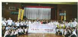
▲海外の学生との交流