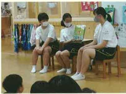
▲保育園実習絵本の読み聞かせ

私は、保育関係の仕事につくために進学したいと思い、普通科生活創造コースを選択しました。生活創造コースでは、保育・フード・ファッションの3つの分野を専門的に勉強し、将来の進路(仕事)や生活と結びつけています。保育実習や調理実習が豊富で、体験を通して学べることがたくさんあります。少人数なので、授業では先生方からいろんなアドバイスをもらえるし質問も気軽にすることができます。また、検定試験では、洋服・和服・食物の3分野の1級取得(三冠王)を目標に日々頑張ることができるので、充実した毎日を過ごしています。ぜひ、生活創造コースで学んでみませんか。