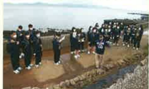
▲フィールドワーク(1年生)