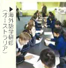
▶海外語学研修(オーストラリア)