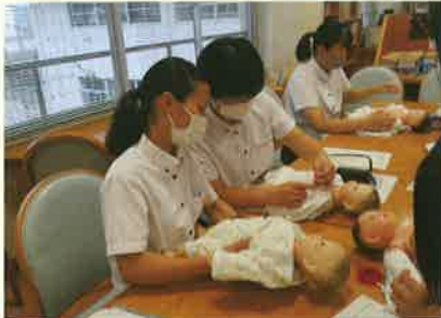
▲助産師講話と実習