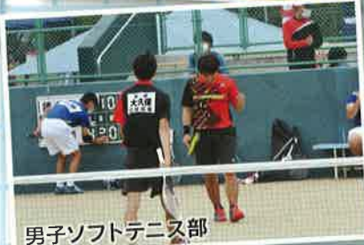
男子ソフトテニス部