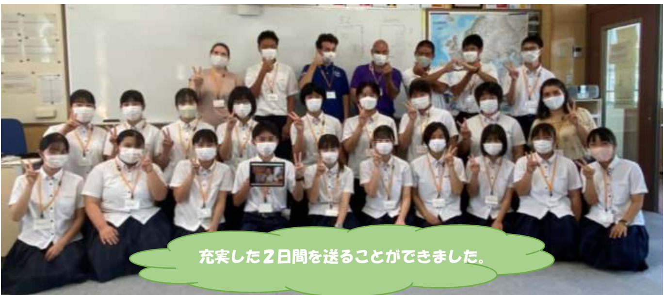
充実した2日間を送ることができました。

生徒の感想より 私は英語が苦手で、英語を話すのなんて絶対できないと思っていました。しかし、いざ始めてみるととても楽しい時間を過ごしていました。長いと思っていた活動もあっという間に終わり、もう少しALTの先生方とお話できたら良かったと後悔が残っています。 これから、英文法を学びなおし、少しでも多くの外国人の方とお話ができたらいいなと思いました。貴重な体験をありがとうございました！とても楽しく活動できました！！