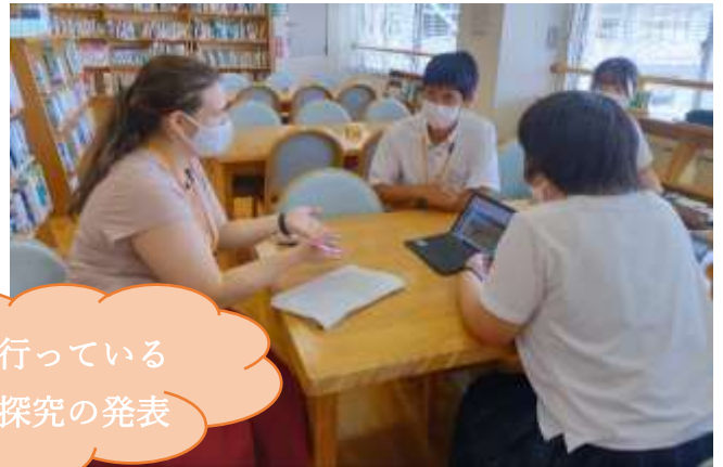
自分たちが行っている グローバル探究の発表