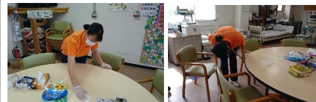
デイサービスで実習を行う1年生