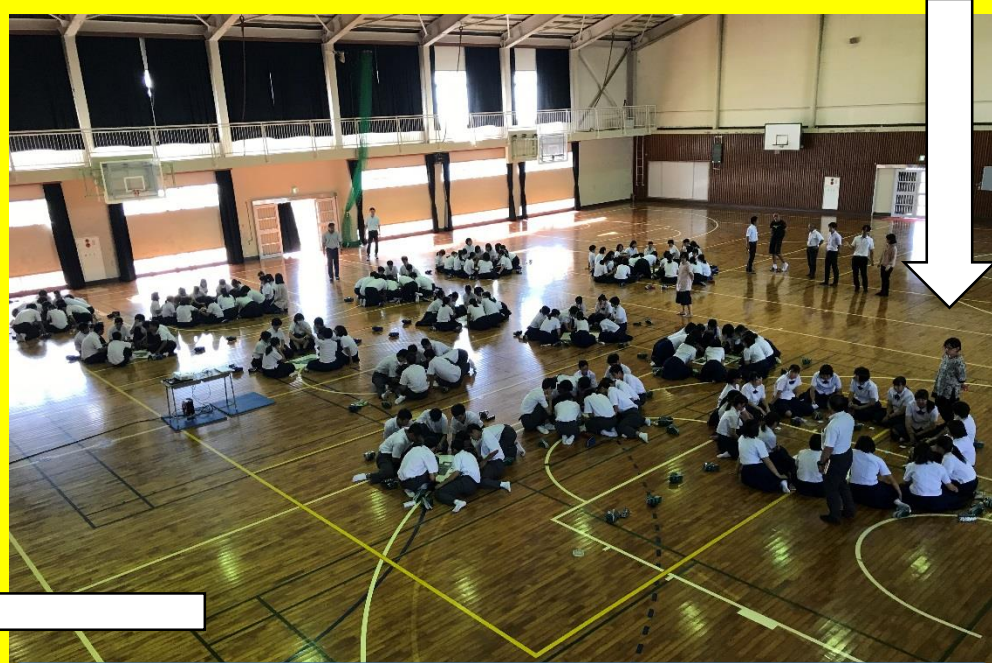
グループに分かれてハザードマップ作成