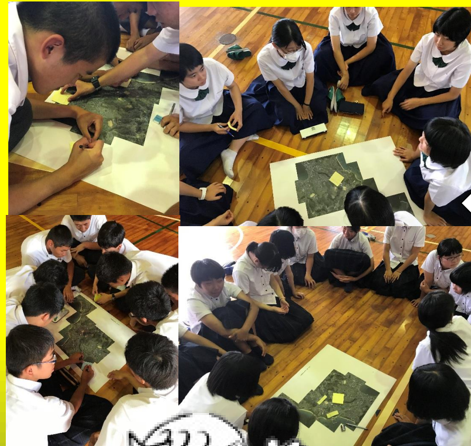
各グループでハザードマップ完成(一部抜粋)