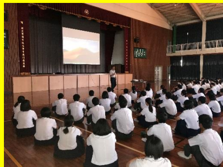
平山生徒指導主事から交通安全学習の主旨の説明