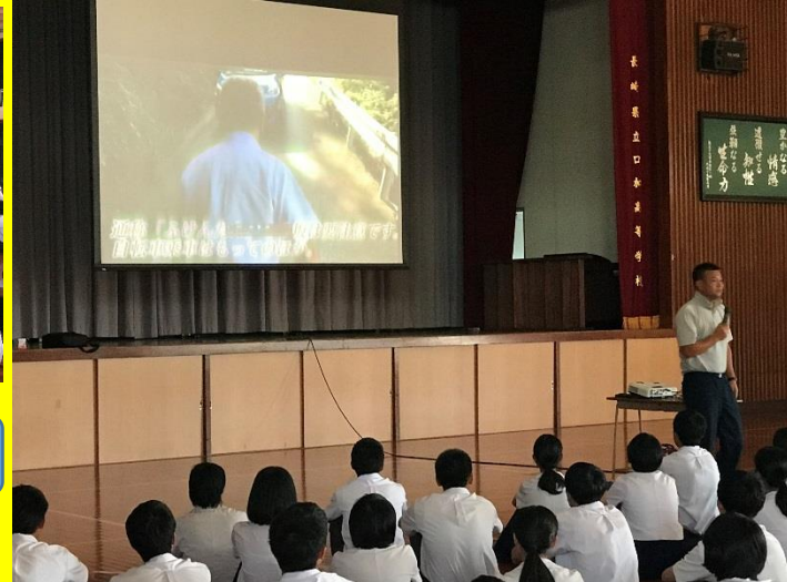
学校周辺の危ない場所を映像で説明