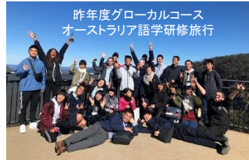
昨年度グローバルコース オーストラリア語学研修旅行