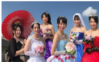
昨年度菖蒲祭「ファッションショー」