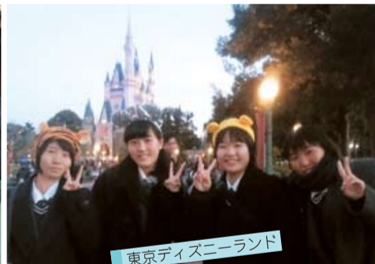
東京ディズニーランド