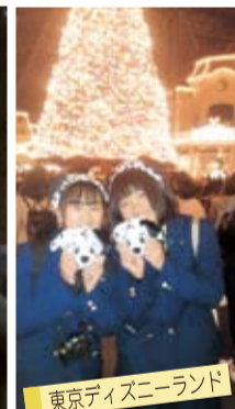
東京ディズニーランド