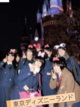
東京ディズニーランド