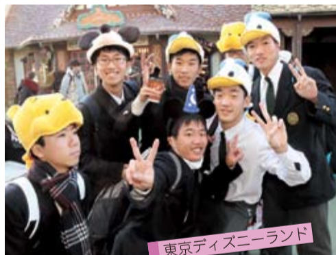
東京ディズニーランド