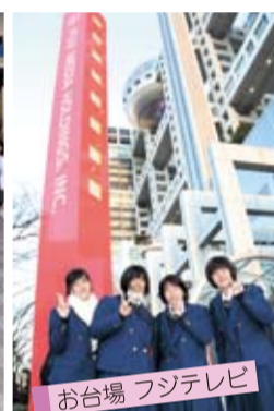
お台場 フジテレビ