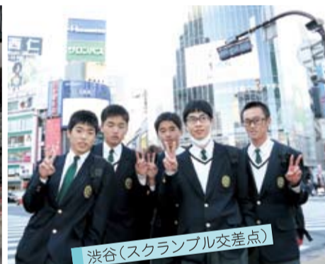
渋谷(スクランブル交差点)