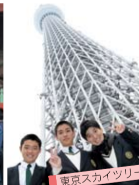
東京スカイツリー

幸せに暮らせていますか？今までの出逢い、これからの出逢いを大切に、常に笑顔で安全運転でいきましょ。