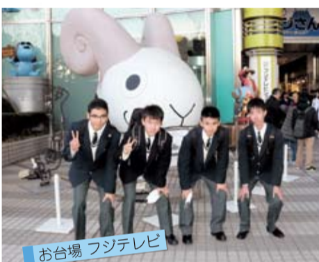
お台場 フジテレビ