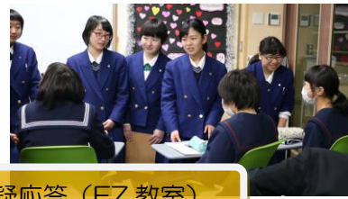
GL 第一期生と質疑応答（EZ 教室）