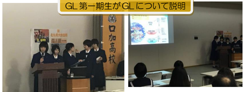
GL 第一期生がGLについて説明