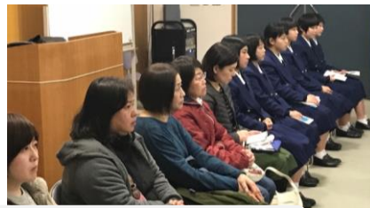
GL 第一期生と保護者が応援に駆けつけてもらいました。