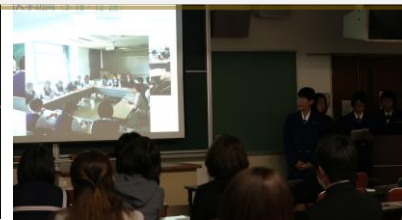
GL 第一期生がGLについて説明