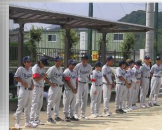
グラウンドソフトボール