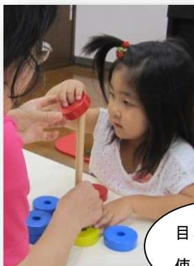
目と手を使った活動