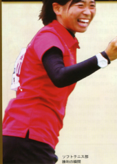
ソフトテニス部 部員の笑顔