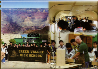
平成28年度の数理探究科行事一覧