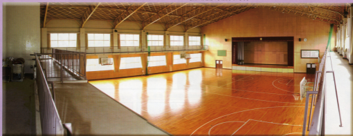
■第1体育館（メインアリーナ） 体育の授業や部活動、そして全校・学年集会などで利用します。第2体育館もあります。