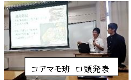
コアマモ班 口頭発表