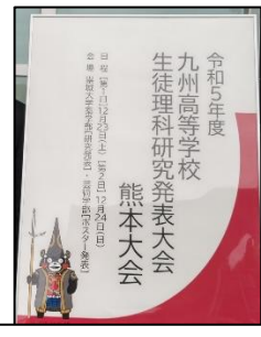
熊本の皆さん お世話になりました！