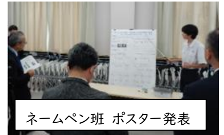
ネームペン班 ポスター発表