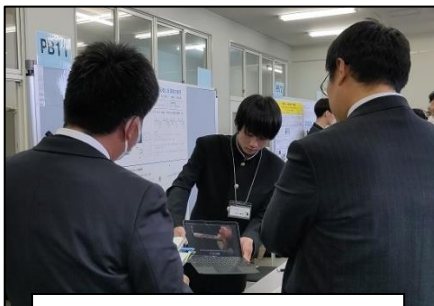
動画も活用してわかりやすく