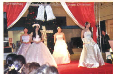
個性が輝くドレス姿が素敵!