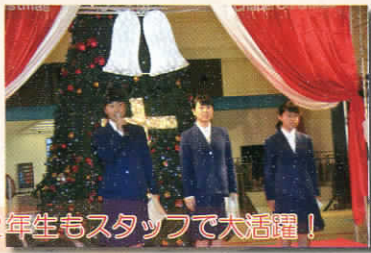
家政科2年生もスタッフで大活躍!

12月20日(日)、長崎空港において、今年で5回目となるエアポートファッションショーが開催されました。会場には保護者の方や友人などたくさんの観客が詰めかけてくださり、3年生にとってとてもよい思い出となりました。