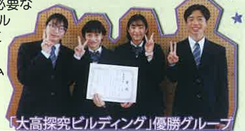
「大高探究ビルディング」優勝グループ

大村高校の探究活動は、全生徒・全職員で取り組んでおり、机上の学習だけではなく、体験を通して、試行錯誤しながら必要なスキルはその都度、身につけていくスタイルで実践しています。先日も新入生を対象に「大高探究ビルディング」という、ものづくりを通して探究活動を体験するプログラムを実施しました。大村高校で、みんなで一緒にSuper Smile Happyになろう!