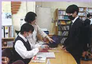
図書館レクチャー