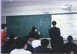
学級目標の話し合い